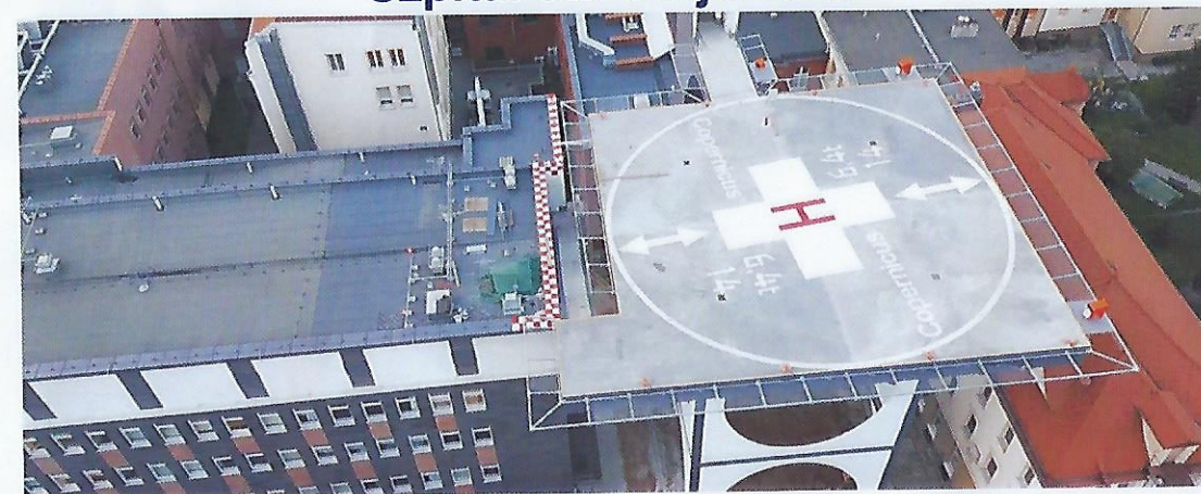
Szpital im. Mikołaja Kopernika