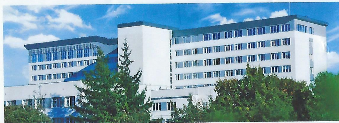
Szpital św. Wojciecha